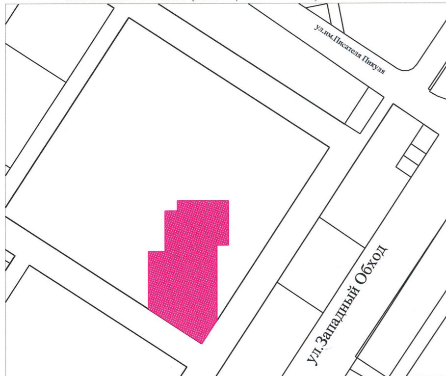
СХЕМА РАСПОЛОЖЕНИЯ ЗЕМЕЛЬНОГО УЧАСТКА В ОКРУЖЕНИИ СМЕЖНО РАСПОЛОЖЕННЫХ ЗЕМЕЛЬНЫХ УЧАСТКОВ (СИТУАЦИОННЫЙ ПЛАН)